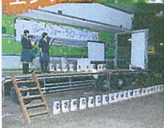
エンピティテーブル