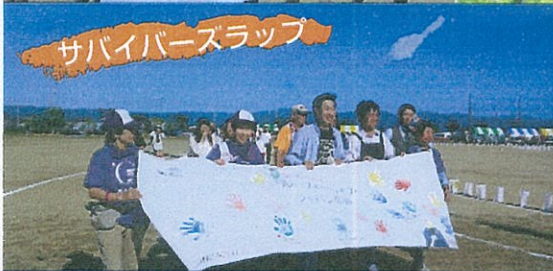
サバイバースラップ