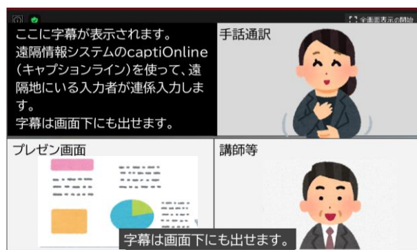
画面イメージ（手話通訳・文字通訳を用意します）